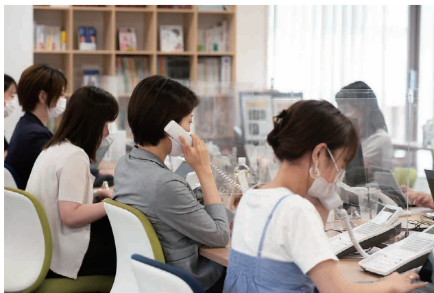
求職者対応部門が応募者の一次対応を代行する

中村 店舗の現場でも原因がそこにあることを認識していないかもしれないですね。しかし対応が遅れた結果、採用できるチャンスを逃し、採用単価が高くなっているのです。北関東圏を例にとると、アルバイトの採用単価は飲食店で2万円から3万円程度です。それがホール企業だと12万円から13万円ほどかかっているのが現実です。